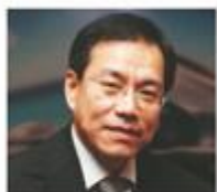
陈良 中德安联人寿保险有限公司首席执行官