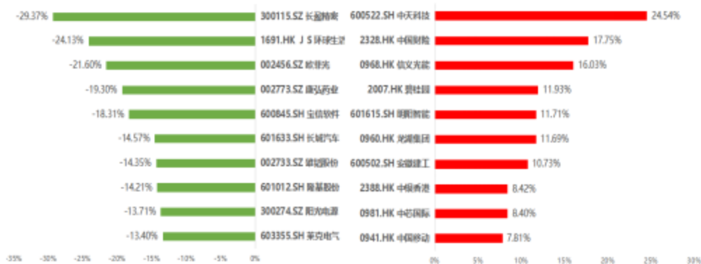
图 3 碧桂园·美好中国 ESG100 指数成分股市场表现排名 (2022/01/18-2022/02/17)