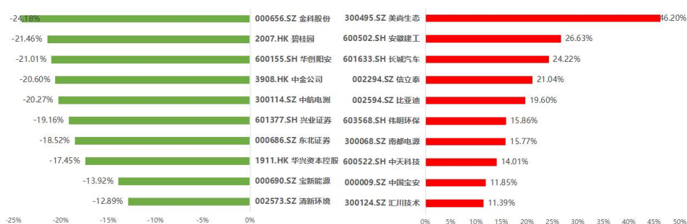
图 3 碧桂园·美好中国 ESG100 指数成分股市场表现排名（2022/04/19-2022/05/18）