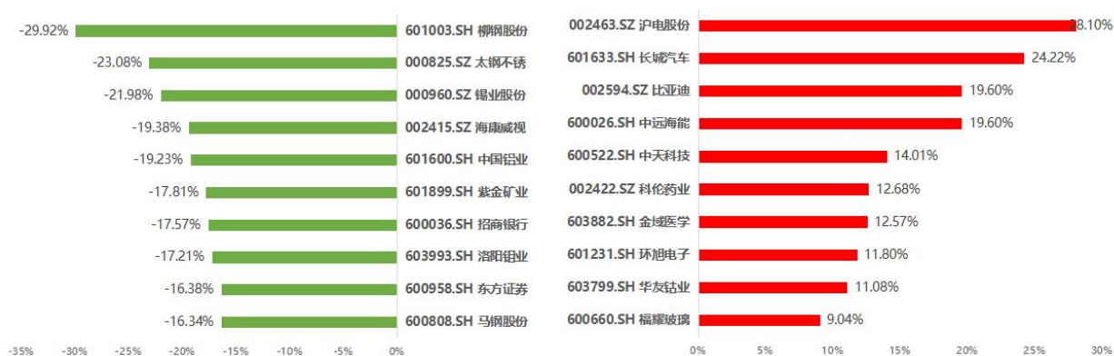
图 3 碧桂园·沪深 ESG100 优选指数成分股市场表现排名（2022/04/19-2022/05/18）